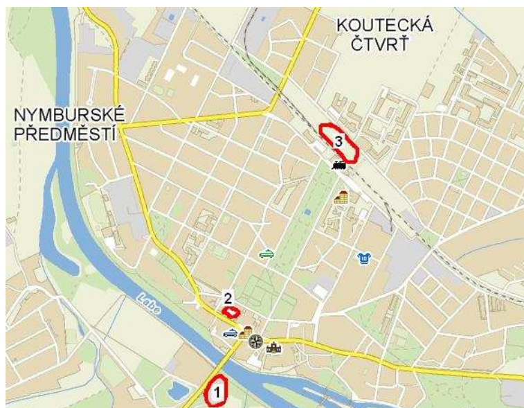
Obrázek 2 - Umístění potenciálních parkovacích ploch na území města Poděbrady [11], vlastní zpracování

Záchytné parkoviště na okraji města má smysl zejména z toho důvodu, že řidiči nebudou projíždět městem a odstaví svoje vozidlo na okraji. Tím se pak sníží intenzita dopravy po městě a také emise CO 2 . Město Poděbrady má pro budování nových parkovišť vytipováno několik ploch, která jsou zobrazeny na Obrázku 2.